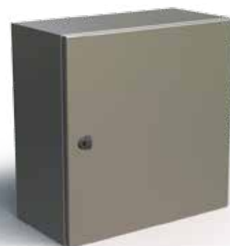
Coffret en acier inoxydable