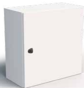
Coffret en tôle d'acier