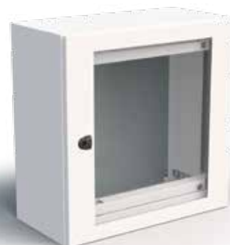
Coffret avec porte vitrée