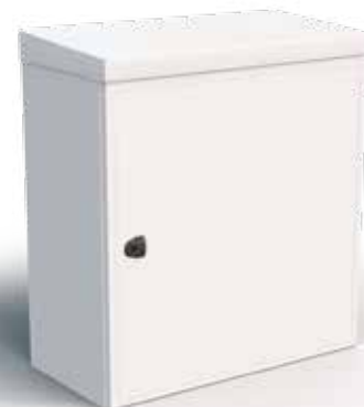
Coffret pour utilisation en extérieur